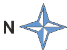
СХЕМА ТРАСИ ЗМАГАННЯ